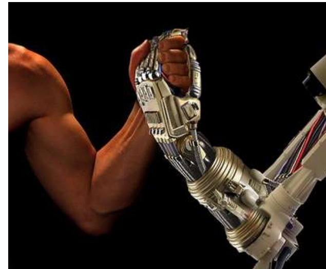
Image: http://workingtropes.lmc.gatech.edu/wiki/index.php/File:Man-vs-machine.jpg License: CC BY-NC-SA 3.0