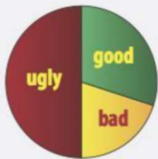
Online Automatic Translation Quality

The native languages of approximately 140 million EU citizens are in the Language Technology Danger Zone , where language technology is inadequate to support the DSM.